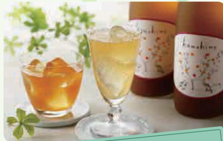
はまゆうセンター はま姫