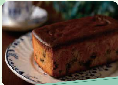
洋菓子の店 シュ・シュ いちじくパウンドケーキ