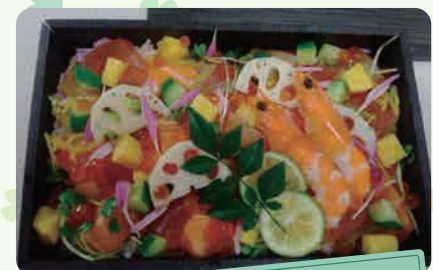
レストランゆずの木 海鮮ちらし箱