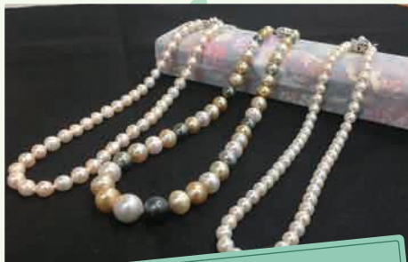
いわお園 真珠ネックレス